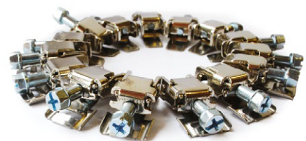
Стопорний пристрій СУ 50 для ХБР 3000