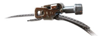
Зручний механізм замка в хомутах ХБ та ХБР